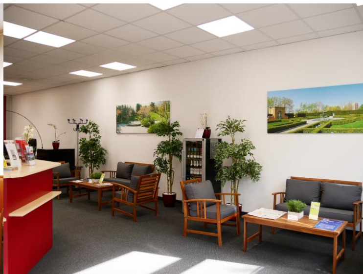
Öffnungszeiten der Rezeption